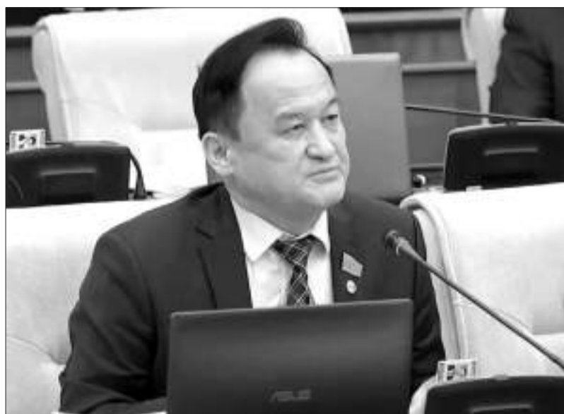
Қазыбек ИСА, ҚР Парламент Мәжілісінің депутаты: