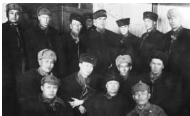
Командный состав 106-й Акмолинской казахской кавалерийской дивизии.

— Что говорится в обнаруженных вами документах о вооружении казахской дивизии?