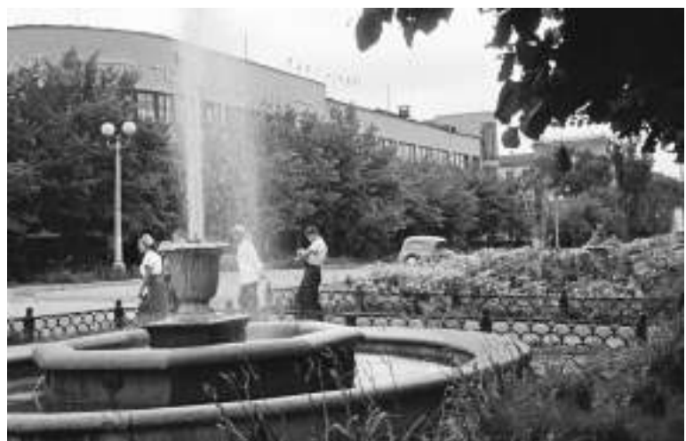
Цветник в 1960-х годах на ул. Кирова, напротив Главпочтамта

Старую арычную систему не только нужно восстановить и построить новые арыки, но и дополнить, где это необходимо, ливневой канализацией. Приостановить принятую реконструкцию некоторых улиц с тем, чтобы восстановить «зеленый наряд» и арычную систему, вернуть былую славу зеленого города, вернуть живую душу города — пустить воду по арыкам.