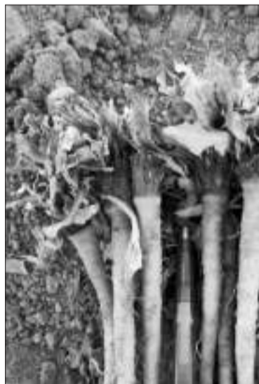
Корни нецветущего кок-сагыза

— Есть в Казахстане институт, который занимается механизацией сельского хозяйства. Сейчас у них