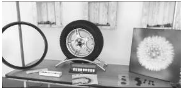
Зимние шины из кок-сагыза, сделанные нашим голландским партнером, «Аполло Фредештайн» — крупным концерном по производству шин любого размера, от шин для лего до шин для самолетов. Эти шины испытаны в зимних условиях Новой Зеландии