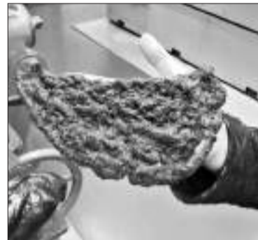
Свежайший кусочек натурального каучука из кок-сагыза

— И больше можно. С нашей продукцией мы можем зайти и на косметический, и на фармацевтический рынки мира.