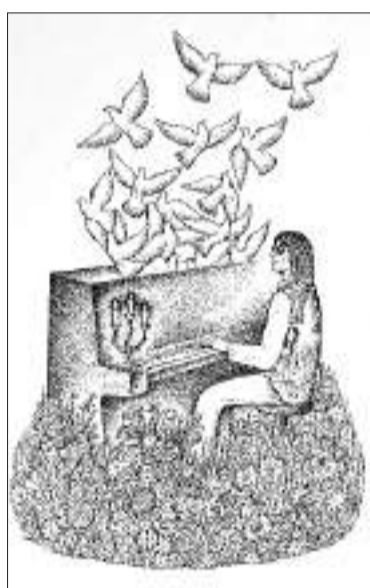
«БИТЛЗ» – НЕ ПУГАЧЕВА С КИРКОРОВЫМ