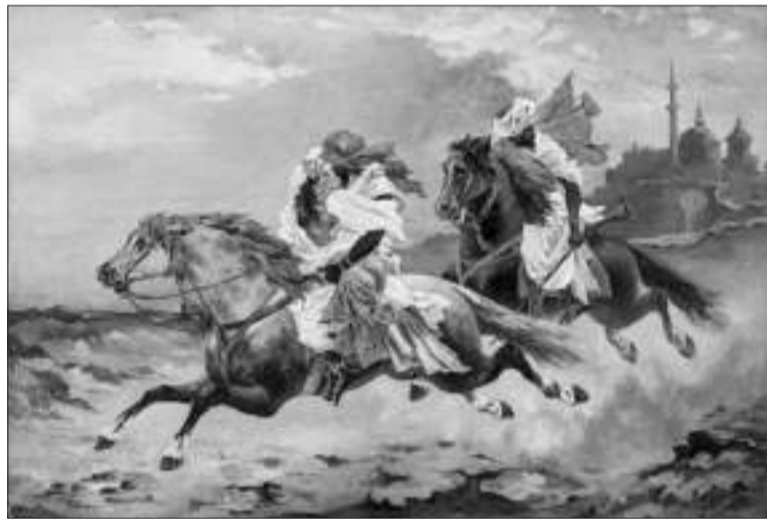
«Похищение любимой невесты». Неизвестный художник