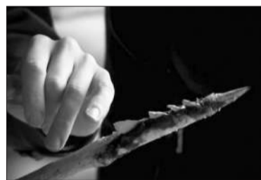
Орудие с наконечником из микролитов

явились в верхнем палеолите на Южном Урале и распространились по всем регионам Евразии. Имеют правильную геометрическую форму: трапеции, треугольника, ромба и т.д. Стороны их всегда скошены под одним углом. Ученые считают, что микролиты в 100 раз острее хирургических инструментов. Их и сейчас используют в микрохирургии. Микролиты были вставлены в пазы, идущие вдоль лезвия костяного кинжала. Вкладыши из ножевых пластин были вставлены и в другие орудия из дерева и кости. На стоян-