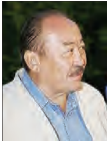
Мұхтар МАҒАУИН, Қазақстанның Халық жазушысы

«Университетті бітірген соң аспирантураға алып қалам, қазақ хандығы дәуіріндегі әдебиетті зерттейсің, дайындала бер!» – деген. Мен дайындалдым. Болашақ ғылыми жұмыстарға ғана емес, үлкен жазушылыққа.