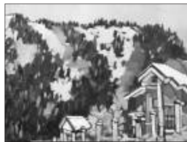
Работа Анары Абжановой