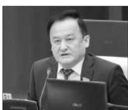
Қазыбек ИСА, ақын, ҚР Парламенті Мәжілісі депутаты