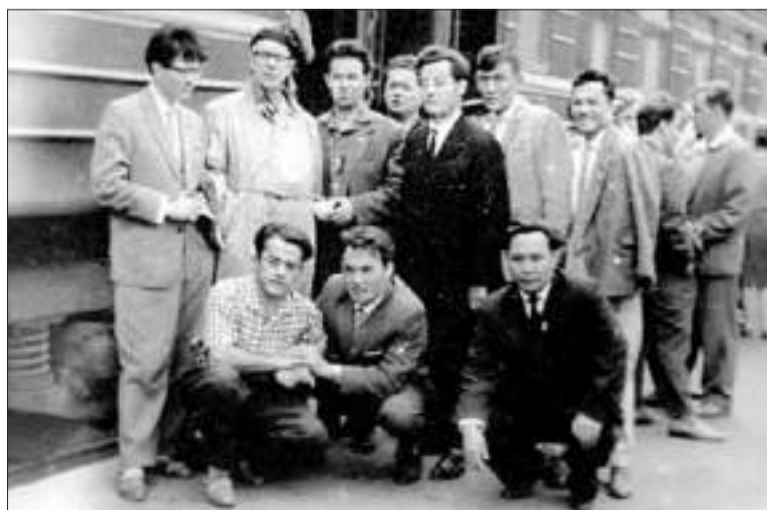
По дороге в Хельсинки.

«Впервые в своей истории мы построили солидную сеть автомобильных и воздушных путей, — рассказывал казахстанским СМИ министр транспорта КазССР (1981–1992 гг.) Шамиль Бекболатов. — Наша огромная страна сильно нуждалась в ней, но Назарбаев оказался первым политическим деятелем, который сумел ее создать».