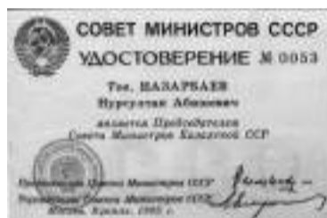
Удостоверение председателя Совета министров

«Это была любимая фишка Суслова, — писал Николай Зенькович в книге «Имя, ставшее эпохой». — Некоторые визитеры, услышав такие слова, объясняли их некомпетентностью хозяина кабинета, который, мол, даже не знал, где находится регион, откуда они прибыли. На самом деле Суслов преследовал иную цель. Если посетитель сразу находил на карте свой город, значит, знал его место в экономике страны».