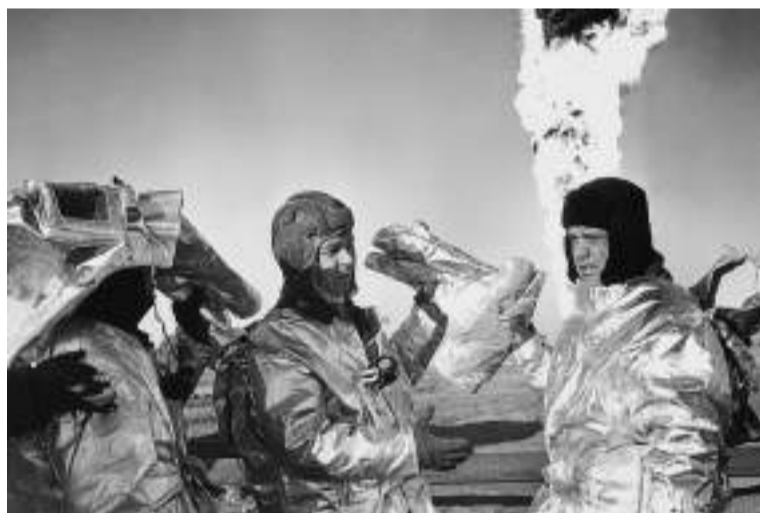
Пожар на скважине 37 на Тенгизе

постановление по улучшению культурно-бытовых условий металлургов казахстанской Магнитки.