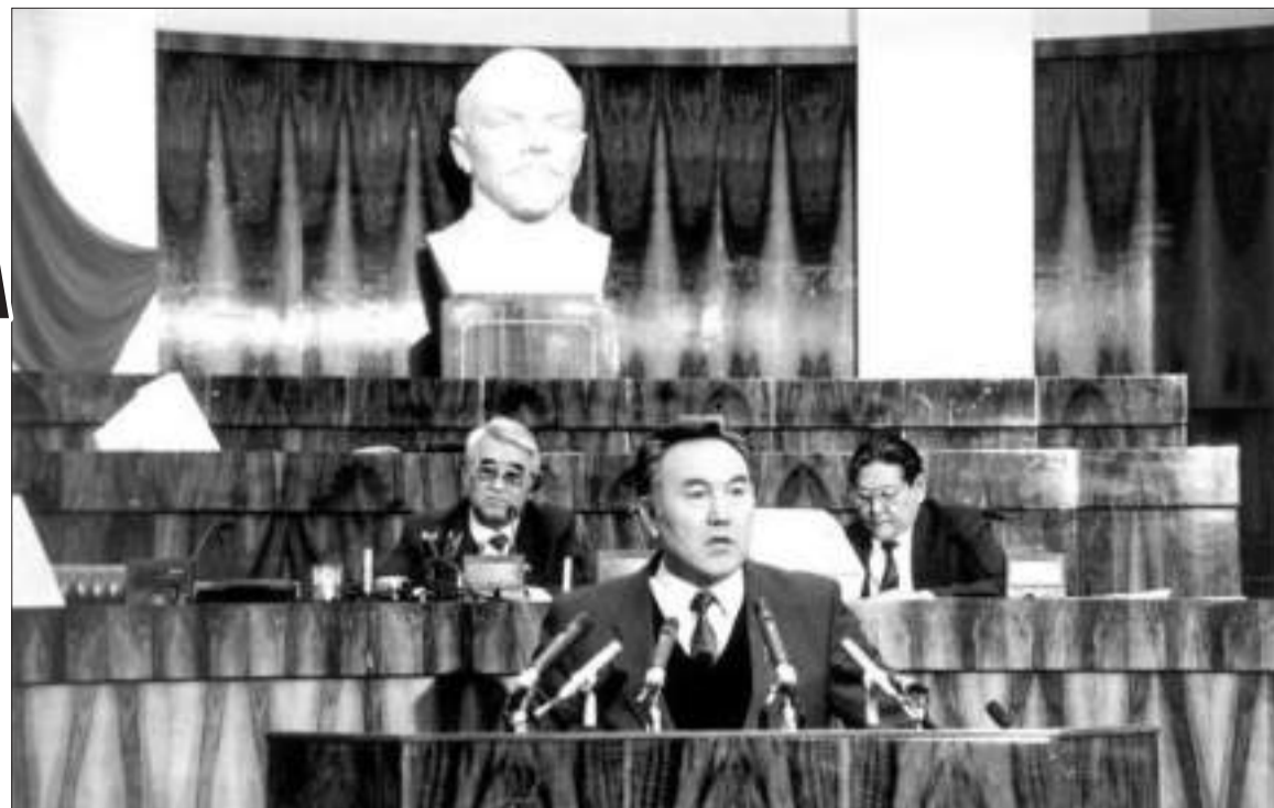
На XVI съезде Компартии Казахстана в Алма-Ате. 1986 год

По итогам заседания в Москве Нурсултан Назарбаев приобрел влиятельного покровителя в Кремле, а Совету министров СССР было поручено принять