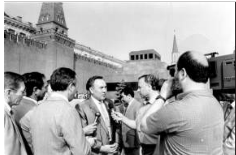
Нурсултан Назарбаев произвел на столичных кураторов очень благоприятное впечатление.

Но будущий президент оказался человеком морально устойчивым и во всех отношениях достойным. Испытательный срок продлился всего три месяца. 14