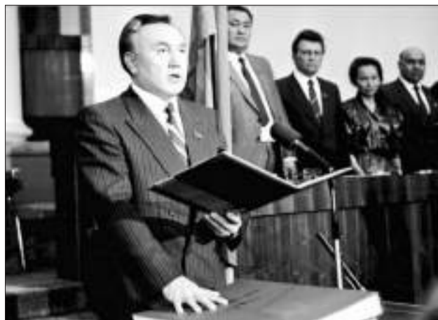
Инаугурация президента Казахстана