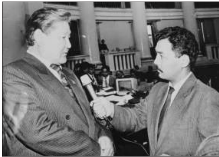
Фото после принятия закона «О государственной независимости Республики Казахстан»

заседания с участием всех 360 депутатов Верховного Совета проходили дважды в год. В тот период было много дел, связанных с всенародными выборами президента. Мы решили приурочить очередную сессию Верховного Совета к вступлению в должность Нурсултана Назарбаева. 10 декабря, еще до церемонии инаугурации, Верховный Совет постановил переименовать КазССР в Республику Казахстан. На следующий день я внес в повестку заседания проект закона «О государственной независимости Республики Казахстан». В течение трех дней, с 14 по 16 декабря, депутаты при-