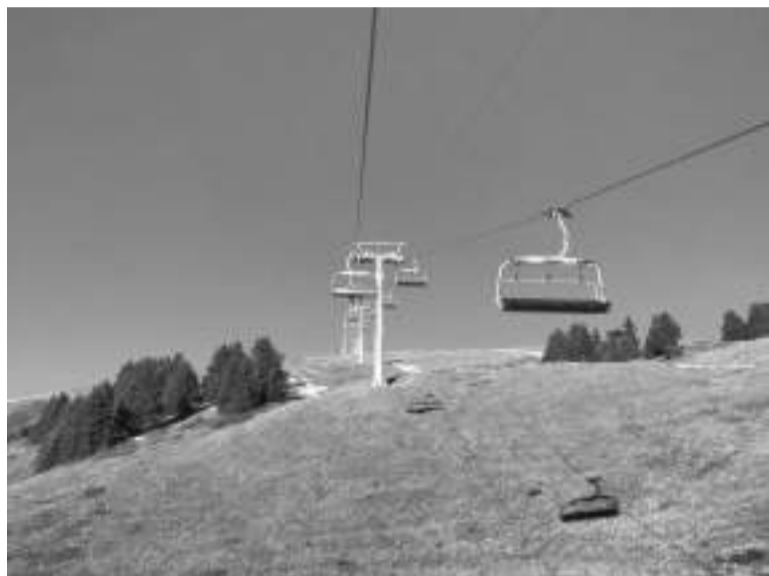
На фото. Вид канатной дороги на горнолыжном курорте Виллар-сюр-Оллон, Швейцария, 1 января 2017 года