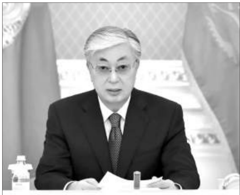
Қасым-Жомарт ТОҚАЕВ Қазақстан Республикасының Президенті