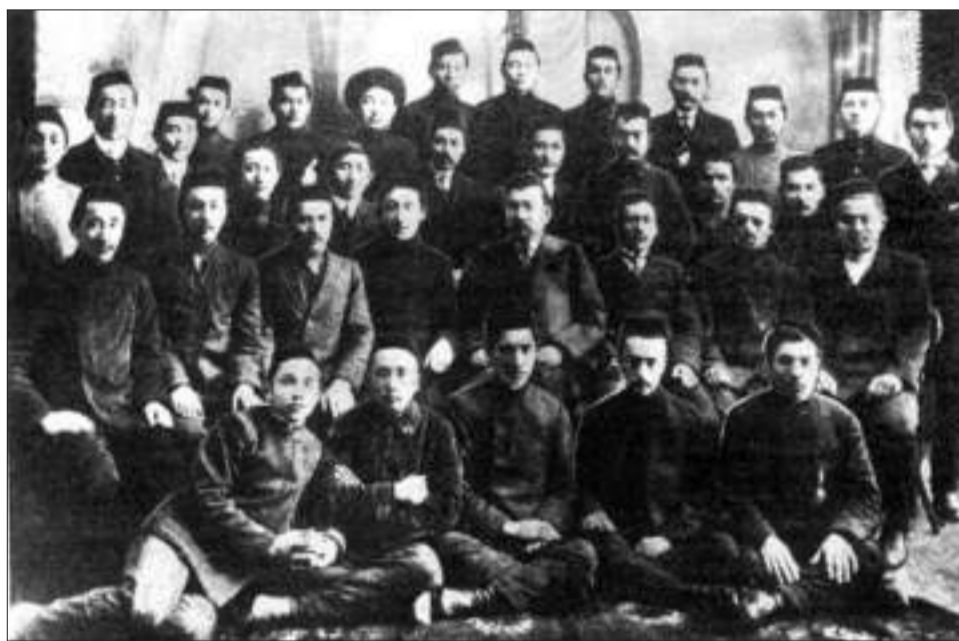
Ахмет Байтұрсынұлов «Ғалия» медресесінің шәкірттерімен бірге. Уфа, 1916 жыл.

Өткен ғасыр басында алашшыл Ахметтер зар қылады: «Хүкіметке жағымдысы – қол астындағы жұрттың жазу-сызуы, тілі, діні бір болу. Россия қол астында түрлі тілді, түрлі дінді, түрлі жазу-сызуды тұтынып отырған жұрттар бар. Солардың бәрі тілін, дінін, жазу-сызуын орысқа аударса, хукіметке ұнамды іс болмақ» («Қазақ» газеті, 9.05.1914 ж.). Қолы ұзын, мойны озық Россияға бұлай болмасын деп дау айтар кім бар?! Тіптен неге өкпелесіп, тонымызды өртеуіміз керек, ол империяның өзіндік ішкі ісі, биліктің ұлық мақсат-мүддесі емес пе? Қайта біз рахмет айтуымыз керек: қазақтың көзі ашылды, ақ патшаға заманында сай тілмаш, отаршын-болыстар дайындалды. Биліктің он ойланып, жүз толғанып тапқан «ғасыр жаналығы» – «русская-киргизская туземная школа»-ға шексіз мадақ айтқанымыз жөн-ақ. Өйткені, қос тілді, қос дінді (шәкірттер екіге жарылып, бірі Құранды жаттаса, бірі «Боже, Отче наш»-ты айтатын) бұл жүйе ғасырлық сынақтан өтті, өзінің өмірлендігін, қазақ үшін өбден диліргілігін дәлелдеді. Өйтпесе бүгінгі самсаған аралас-құралас мектептер баяғыда жойылып-ақ кетпес пе еді!?