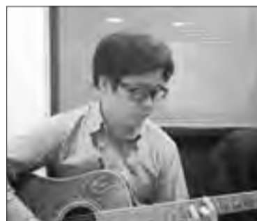
Владислав Тен поет песни Виктора Цоя на казахском и корейском языках

Хотя это не умаляет достоинств узбекского языка. И в узбекском есть сложные моменты. Например, с настоящим продолженным временем глагола, по-