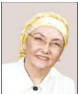
Күләш АХМЕТОВА, ақын, мемлекеттік сыйлықтың лауреаты