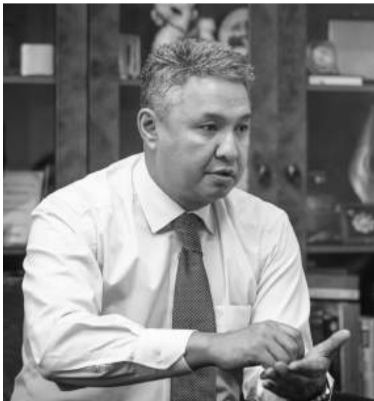
Азат ПЕРУАШЕВ, Парламент Мәжілісінің депутаты, «Ақ жол» партиясының төрағасы:

«Мен музыкадан сабақ беремін», – деді мұғалім. «Зындан музыкамен айналысың», – деді президент. Оның үстіне президент сөздерін байыппен, қатқыл үнсіз жеткізді. Ол өз ісін білмейтін шенеунікті орынан да алды, өзін сынаған азаматқа да дұрыс жауабын берді. Ол кезде Назарбаев ізденіс үстінде болатын. Алматыда, басқа да өңірлерде көптеген кездесулер өткізді. Осы отырыс басталмас бұрын бізге сауал-