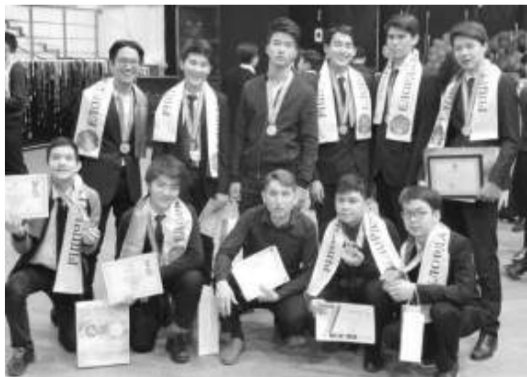
Республиканская олимпиада по математике, 2018 год

Ушедший 2021 год для казахстанских школьников стал урожайным на медали. Ребята завоевали 26 медалей из 31 возможной на мировых олимпиадах, обновив тем самым рекорды последних лет. Всего в копилке сборной Казахстана две золотые, 13 серебряных и 11 бронзовых медалей.