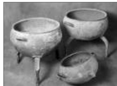
Бронзовые котлы. Близ Алматы

У них был ободок, который описан у Геродота, когда царь умирал, его бальзамировали и возили по всем родам в течение... года и только потом хоронили.