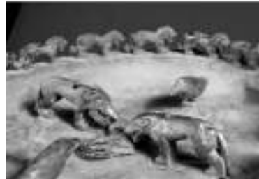
Бронзовая курительница. Поселок Ерменсай, южнее г. Алматы