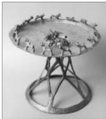
Бронзовая курительница. Алматы

— 14 м, диаметр — 150 м. Сам могильник представляет собой цепь из 52 курганов, составляющих, несмотря на свою протяженность, единый и целый ансамбль.