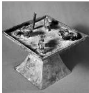
Бронзовая курительница. Между р. Большая Алматинка и р. Поганка

— Есть определенные мифологические воззрения, почему могильники располагались именно вдоль рек. В связи с этим интересны этнографические параллели, отмеченные в XIX в. Джоном ГРЭЕМ. В Китае есть известный труд — «Похоронный фэншуй», на него идут частые ссылки у Джона Грэя в книге «Древний Китай». Там указывается, что места для похорон выбирали специалисты — геоманты, и, как правило, захоронения располагались на склонах холмов и берегах рек. Тот же самый крупный Боралдайский курган стоит между 2 реками — с одной стороны Боралдай, с другой — Большая Алматинка, — говорит Мурат Нурпейсов.