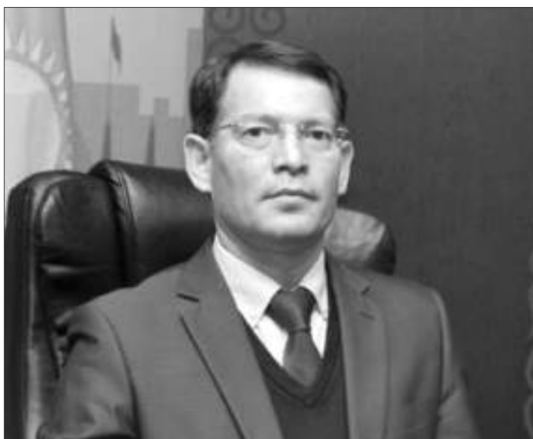
Ғабит МӘУЛЕНҚҰЛОВ, Шымкент қаласы Әл-Фараби ауданының әкімі: