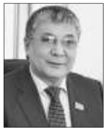
Мұрат БАҚТИЯРУЛЫ, ҚР Парламенті Сенатының депутаты

Қос палатының біріккен отырысына Президент қатысып, халыққа Жолдауын арнады.