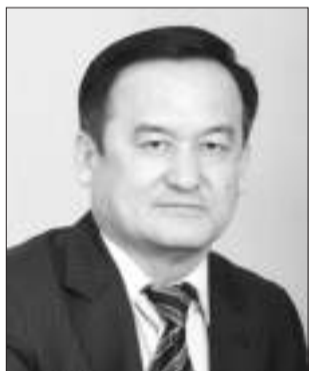
Қазыбек ИСА, ҚР Президенті жанындағы Ұлттық кеңес мүшесі, «Ақ жол» партиясы төрағасы орынбасары

ландырып, оң қадам жасау үшін мемлекеттік қызметкерлердің төрттен бірі – 25 пайызы қысқартылады. Бұл өте дұрыс!