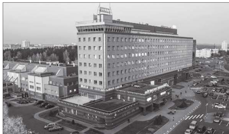
Парк высоких технологий в Минске

В прошлом году Беларусь договорилась с Китаем о кредите в размере $500 млн, чего не могла получить от России. В 2015 году Минск получил $528,1 млн, в 2016-м – $446,9 млн, в 2017-м – $306,6 млн, в 2018-м – $509,2