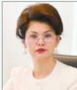
Құрметпен, Аида БАЛАЕВА, Қазақстан Республикасы Ақпарат және қоғамдық даму министрі

«Қазақ үні» республикалық қоғамдық-саяси апталық ұжымына отбасылық бақыт, шығармашылық шабыт тілеймін. Газеттің алар асуы биік, ғұмыры ұзақ болсын!