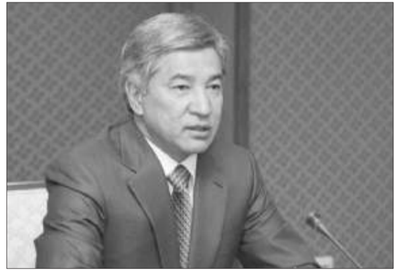
ИМАНҒАЛИДЫ МӘСKEУДЕН, ИСЛАМДЫ ТҮРМЕДЕН АЛДЫРУ КЕРЕК!..